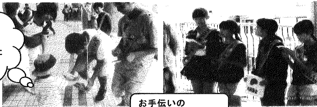
お手伝いの ジュニアボランティア