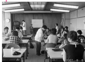
福寿荘でお昼を食べました

最後まで水に入りっぱなしの子どもたちにはあっというまの1時間、着替えの後はさすがにベンチにぐったりでしたが、その顔は満足な表情をしていました。