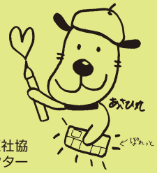
旭区社協 マスコットキャラクター